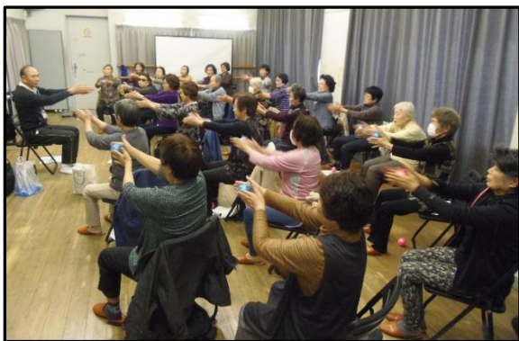
やさしい健康体操

天白文化小劇場練習室で「やさしい健康体操」と「歌謡リズム体操」を月1回実施することになりました。