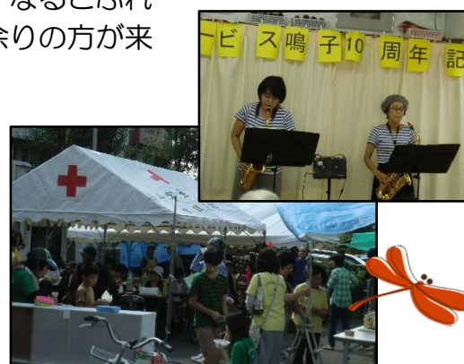
ふれあいまつりの様子